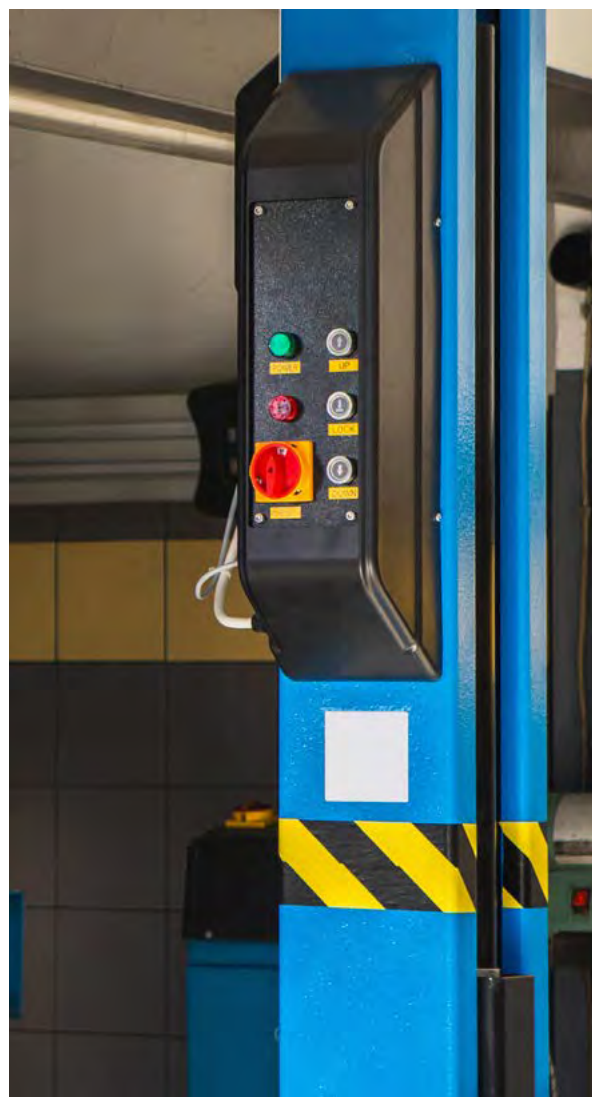
Fot. 1. Elementy sterownicze

Ciałami powoływanymi do prowadzenia prac normalizacyjnych są Komitety techniczne (TC – Technical Committee). Komitety realizują swoje zadania poprzez poszczególne Grupy robocze (WG – Working group). Osoby, które mają bezpośredni wpływ na treść postanowień danej normy, to Ekspertki WG. Oni właśnie są członkami wspomnianych Grup roboczych. Jest to środowisko międzynarodowe, które reprezentuje niezliczone dziedziny, jak np. branża przemysłowa, sektor bezpieczeństwa eksploatacji, ochrony środowiska, badań naukowych, budownictwo, energetyka oraz wiele innych. Ekspertki WG do prac w międzynarodowych organizacjach normalizacyjnych, takich jak ISO, IEC, CEN (ISO – International Organization for Standardization, IEC – International Electrotechnical Commission, CEN – Comité européen de normalisation), są zgłaszani przez krajową jednostkę normalizacyjną – Polski Komitet Normalizacyjny w przypadku Polski. Urząd Dozoru Technicznego jako organizacja ekspercka posiada wielu swoich reprezentantów w krajowych oraz zagranicznych Komitetach Technicznych, tym samym biorąc czynny udział w działalności normalizacyjnej na szczeblu krajowym oraz międzynarodowym.