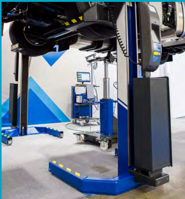
Fot. 7. Zestaw podnośników mobilnych