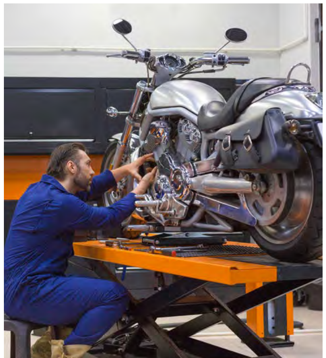
Fot. 5. Podnośnik do obsługi motocykli

7) Określono wymagania dla podnośników obsługujących motocykle (4.23).