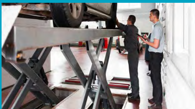
Fot. 6. Badanie techniczne pojazdu z wykorzystaniem dźwignika