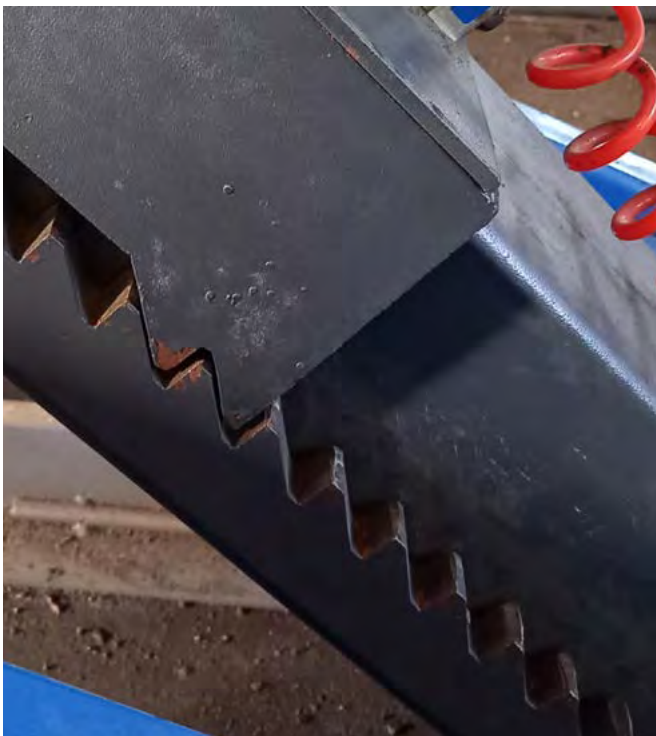
Fot. 3. Blokada mechaniczna

5) Zmodyfikowano i doprecyzowano wymagania bezpieczeństwa związane z uszkodzeniem mechanicznych elementów nośnych (4.13 oraz załącznik C).