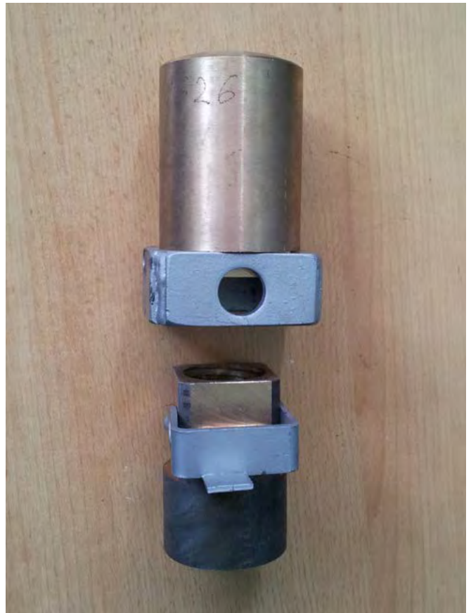
Fot. 4. Zestaw nakrętek – nośna oraz bezpieczeństwa

6) Określono wymagania dotyczące widoczności przy obsłudze podestów mobilnych (4.16.6).