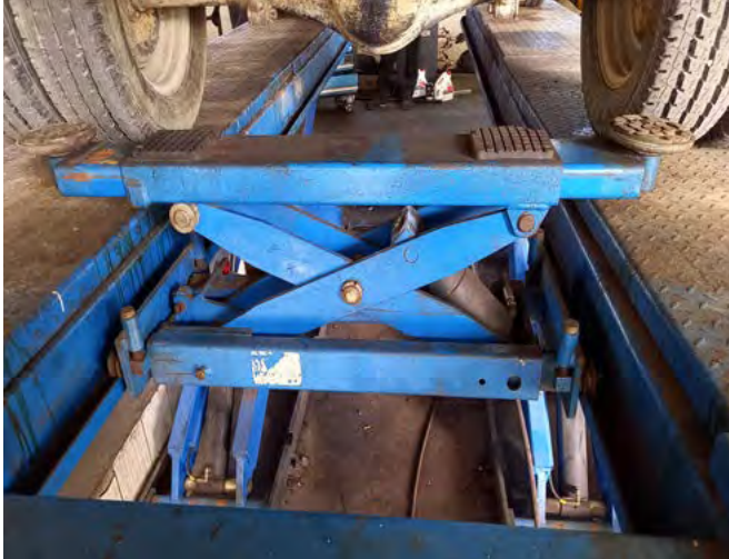
Fot. 2. Podnośnik pomocniczy zamontowany na podnośniku nożycowym

3) Określono wymagania podnośników przejezdnych lub innego wymiennego osprzętu , stosowanego na najezdnicach podnośnika (4.7.4.5).