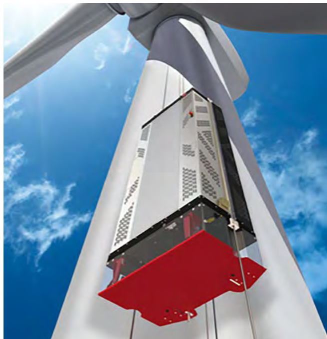
Rys. 3. Przykłady podestów wiszących

Rozwiązaniem są montowane na stałe podesty wiszące, które służą do przewożenia ludzi oraz sprzętu do konserwacji i inspekcji elementów turbiny.