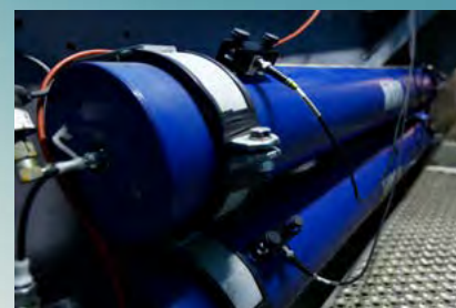
Rys. 1. Hydroakumulator w siłowni wiatrowej

W przypadku badań metodą AE (ang. Acoustic Emission - AE lub Acoustic Emission Testing - AT) typowych urządzeń ciśnieniowych lub płaszczów magazynowych fala AE propaguje od źródła bezpośrednio w materiale (metalu) i przetwarzana jest na sygnał AE przez czujniki rozmieszczone na powierzchni ścianki badanego urządzenia. Następnie sygnał AE rejestrowany i przetwarzany jest przez system pomiarowy AE. W tym przypadku emisja akustyczna w postaci fal sprężystych generowana jest przez powierzchniowe i wewnętrzne nieciągłości w materiale ścianki, spoinach i elementach badanego urządzenia, podlegających działaniu bodźca w postaci obciążenia (np. ciśnienia) w trakcie badania, co jest wynikiem wyzwolenia energii w materiale.