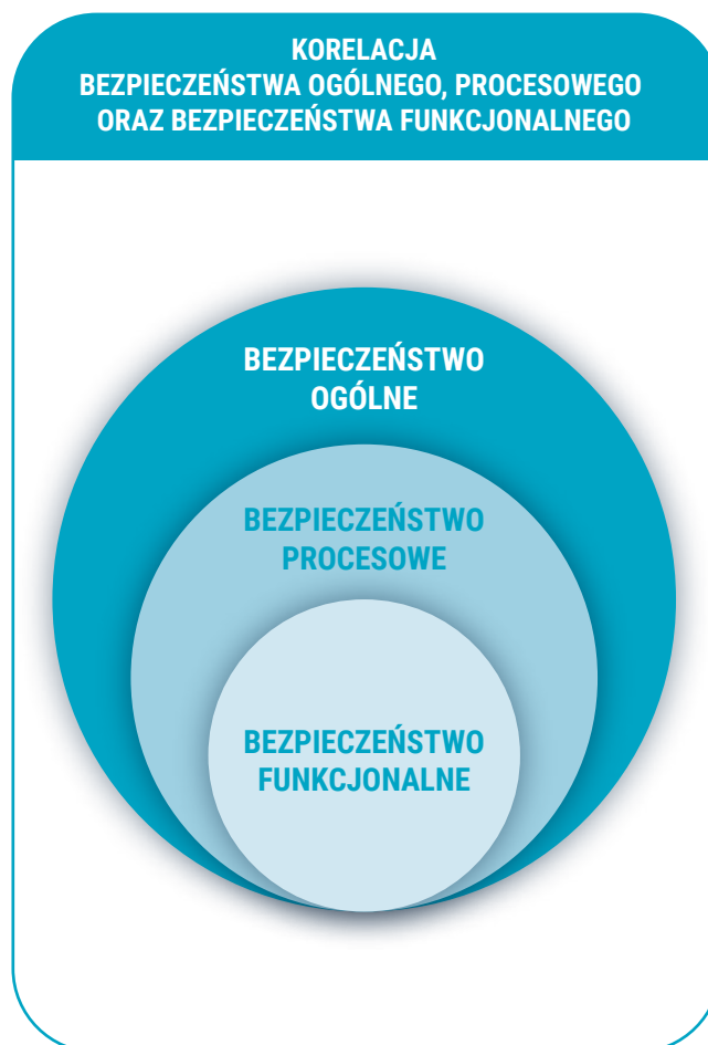
Rys. 1. Korelacja bezpieczeństwa ogólnego, procesowego oraz bezpieczeństwa funkcjonalnego

Korelacja bezpieczeństwa ogólnego, procesowego oraz bezpieczeństwa funkcjonalnego